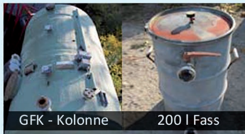
GFK - Kolonne

PE - Behälter mit einem Nutzvolumen von zwei Kubikmeter und Füllstandsmesseinrichtung (Niveau)