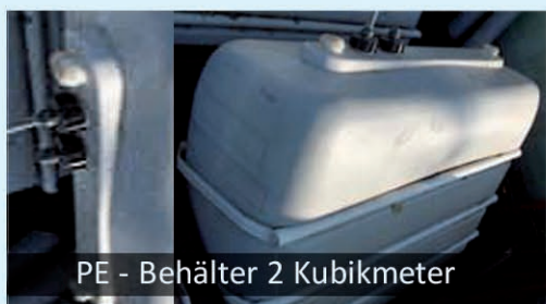
PE - Behälter 2 Kubikmeter

PE - Behälter mit einem Nutzvolumen von einem Kubikmeter und Füllstandsmesseinrichtung (Niveau)